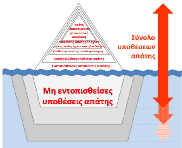
Γράφημα 2 - Επίπεδα απάτης

περιπτώσεων απάτης, κάτι που επηρεάζει την αποτελεσματικότητα των δράσεων καταπολέμησης της απάτης. Η εφαρμοζόμενη σήμερα προσέγγιση, στο πλαίσιο της οποίας η OLAF (Ευρωπαϊκή Υπηρεσία Καταπολέμησης Απάτης) κινεί διοικητική έρευνα αφότου λάβει πληροφορίες για υπόνοιες απάτης από άλλες πηγές, και συχνά έπεται ποινική διερεύνηση της υπόθεσης σε εθνικό επίπεδο, είναι εξαιρετικά χρονοβόρα σε σημαντικό αριθμό περιπτώσεων με αποτέλεσμα να μειώνονται οι πιθανότητες δικαστικής δίωξης (μόλις το 45% των περιπτώσεων οδήγησε σε ποινική δίωξη των υπόπτων για απάτη)